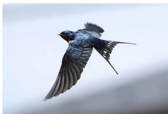
Jaskółka w locie