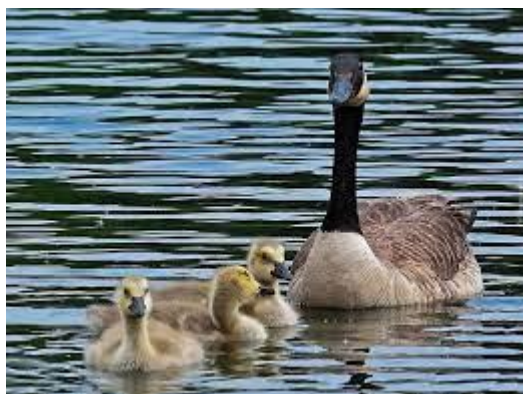
Mama gaska i jej dzieci...