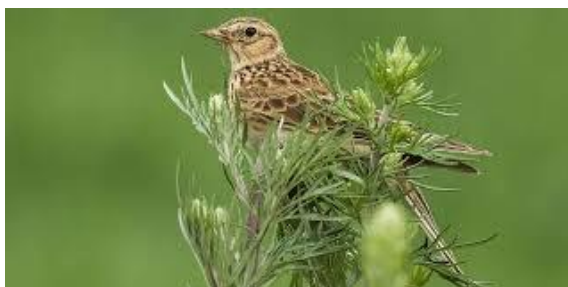
skowronek ukryty wśród igliwia

Ptaki wędrują dniem lub nocą. W ciągu dnia wędrują ptaki oswojone z otwartą przestrzenią, potrafiące umknąć w powietrzu atakom drapieżników, lub gatunki leśne, które lecąc na małych wysokościach, w przypadku zagrożenia mogą szybko ukryć się. Wędrując nocą ptaki unikają zagrożeń ze strony dziennych ptaków drapieżnych i zmniejszają utratę wody.